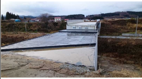
津谷こ線橋(酒田方向)