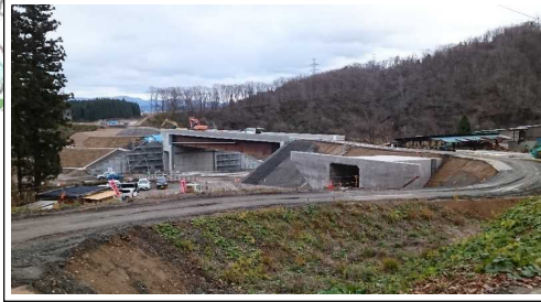
升形地区(大崎方向)