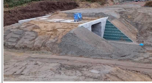
前波地区(酒田方向)