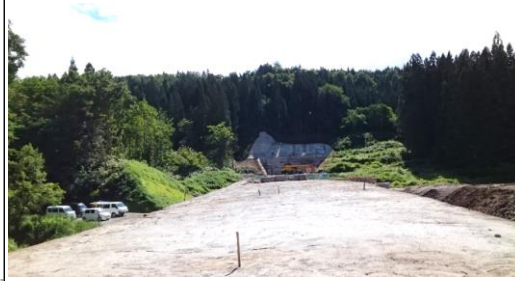
前波地区(酒田方面)