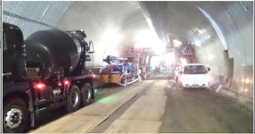
岩清水トンネル(新庄方面)