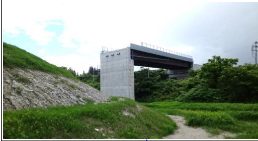
津谷こ線橋(酒田方面)