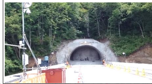
前波トンネル(酒田方面)