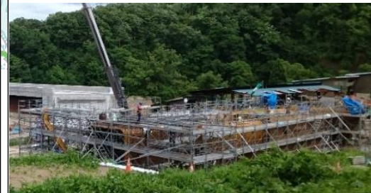
升形地区(新庄方面)