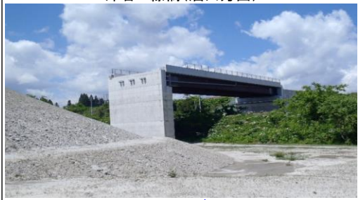
津谷こ線橋(酒田方面)