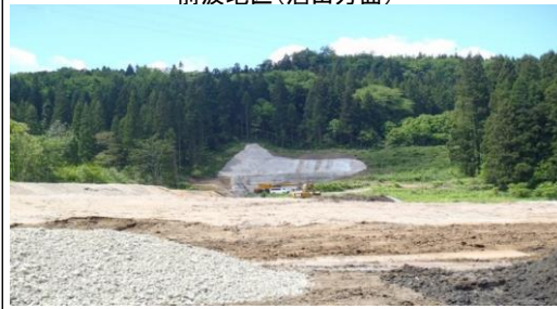
前波地区(酒田方面)