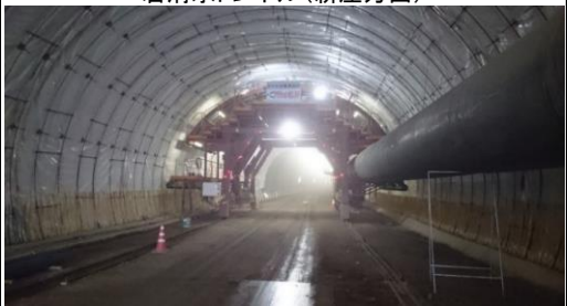
岩清水トンネル(新庄方面)