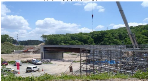
升形3号橋(新庄方面)