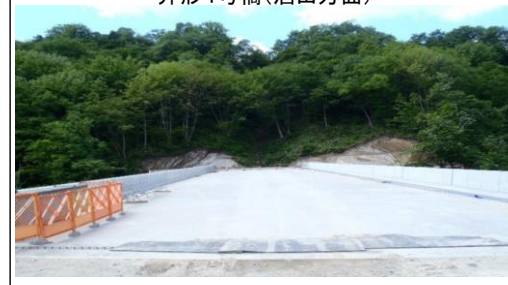
升形4号橋(酒田方面)