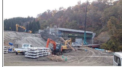
升形4号橋(酒田方面)