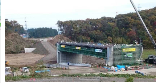
升形3号橋(新庄方面)