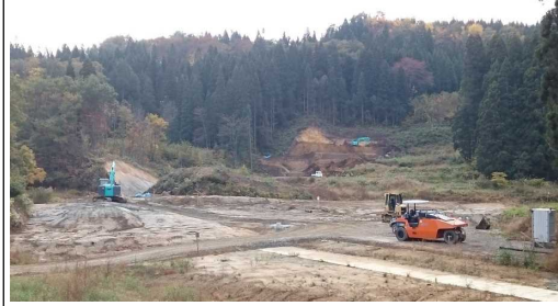
前波地区(酒田方面)