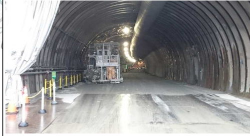
岩清水地区(新庄方面)