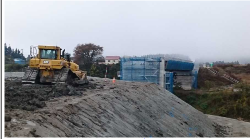
津谷跨線橋付近(酒田方面)