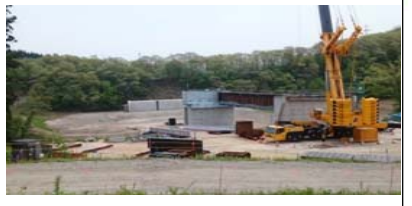
升形3号橋(新庄方面)