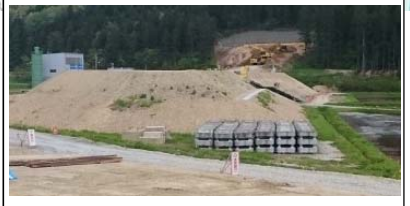
岩清水地区(新庄方面)