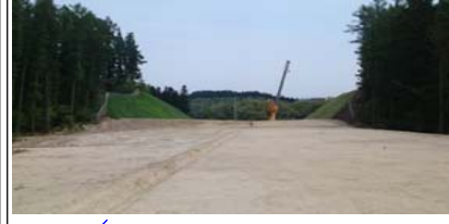
升形地区(新庄方面)