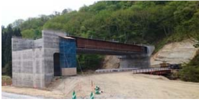
升形4号橋(酒田方面)