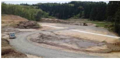
前波地区(酒田方面)