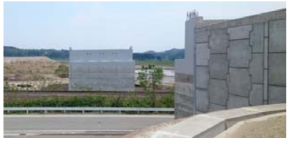
津谷跨線橋付近(新庄方面)