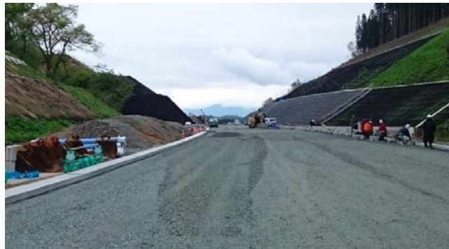
蔵岡・皿嶋地区(新庄方面)