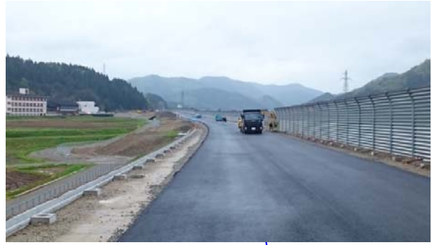
古口地区(酒田方面)