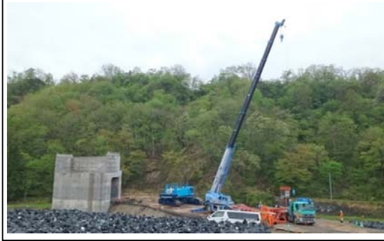
升形4号橋A1橋台(戸沢方面)