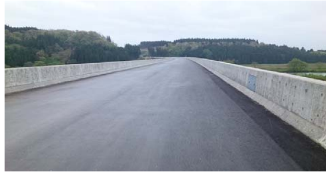
最上川大橋(新庄方面)