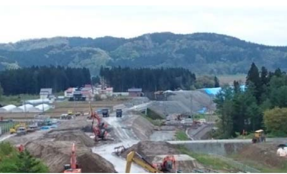
蔵岡・岩花地区(新庄方面)