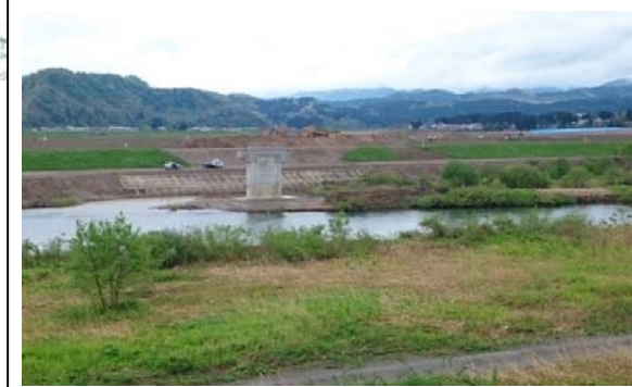
鮭川橋(左岸から津谷方面)