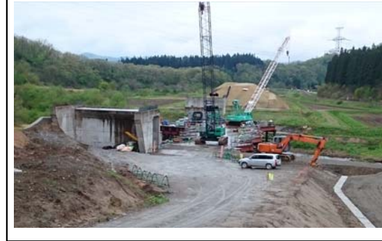
升形1号橋(戸沢方面)