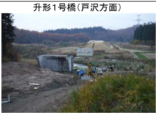
升形1号橋(戸沢方面)