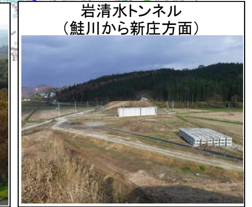
岩清水トンネル (鮭川から新庄方面)