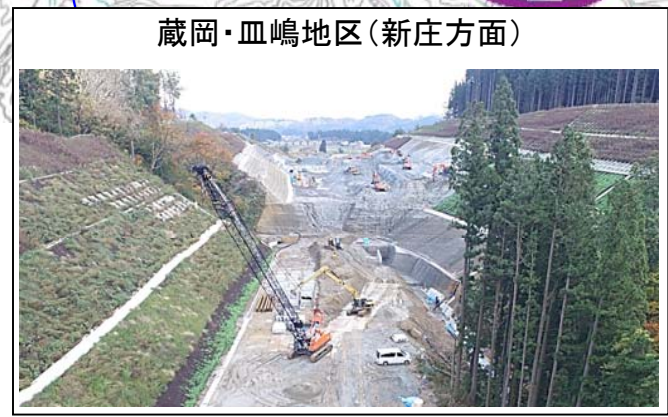
蔵岡・血嶋地区(新庄方面)