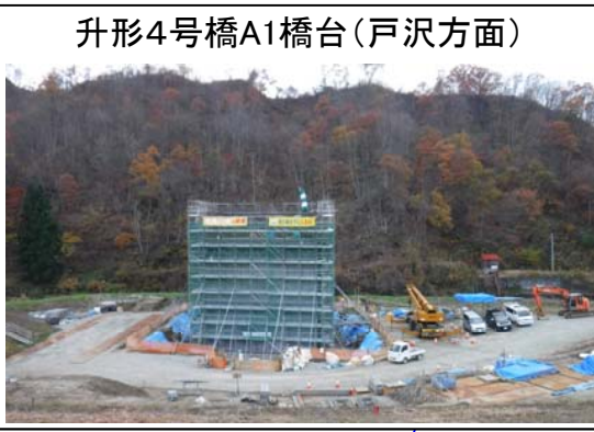
升形4号橋A1橋台(戸沢方面)