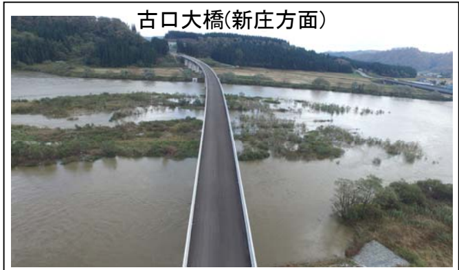
古口大橋(新庄方面)