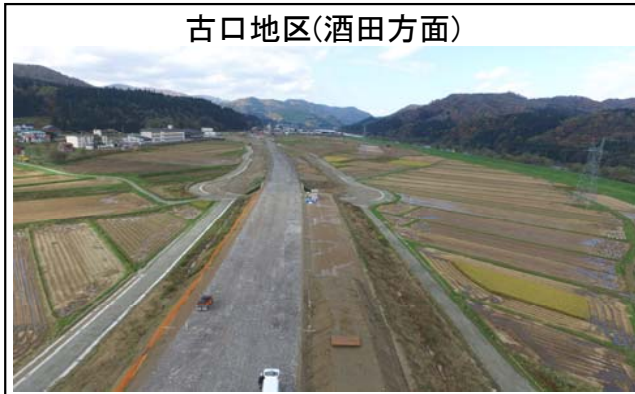
古口地区(酒田方面)