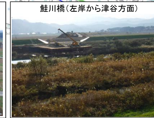
鮭川橋(左岸から津谷方面)