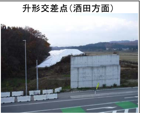
升形交差点(酒田方面)