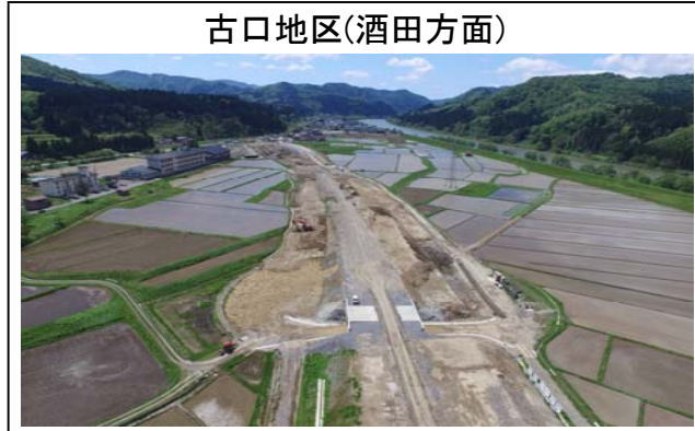
古口地区(酒田方面)