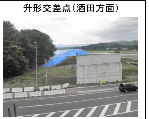
升形交差点(酒田方面)