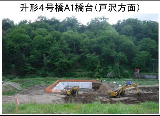
升形4号橋A1橋台(戸沢方面)