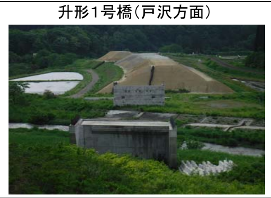
升形1号橋(戸沢方面)