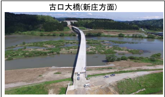
古口大橋(新庄方面)