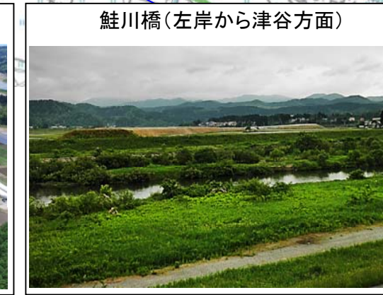
鮭川橋(左岸から津谷方面)