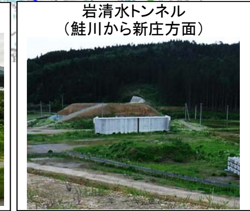
岩清水トンネル (鮭川から新庄方面)