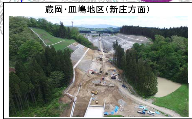
蔵岡・血嶋地区(新庄方面)