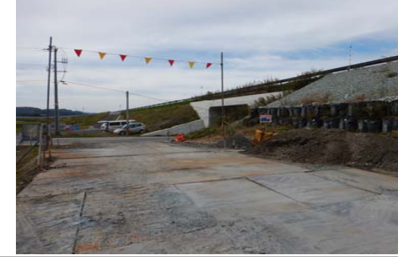
福宮地区(酒田方面)