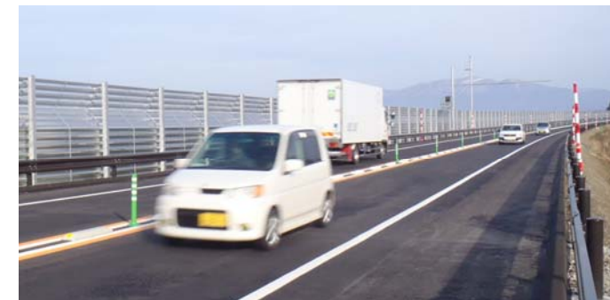
新庄古口道路(本合海～升形) L=2.4km 開通後の状況