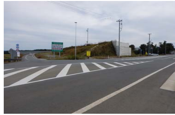
升形交差点(新庄方面)