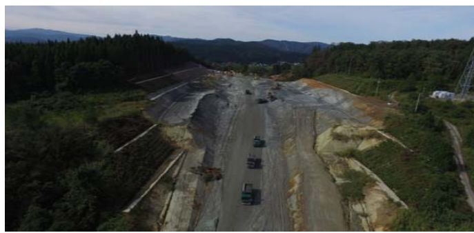
蔵岡地区(酒田方面)