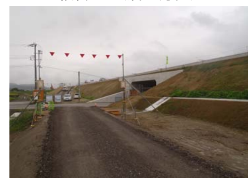
福宮地区(酒田方面)