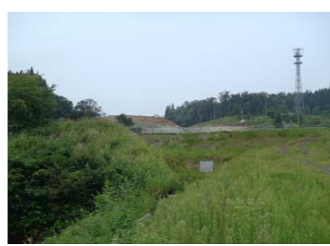
津谷地区(酒田方面)