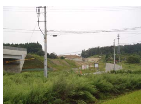
津谷地区(酒田方面)