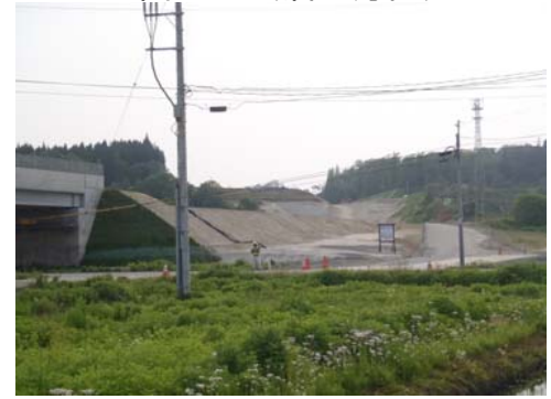
津谷地区(酒田方面)