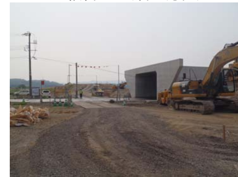
福宮地区(酒田方面)