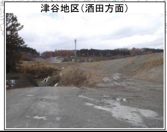
津谷地区(酒田方面)