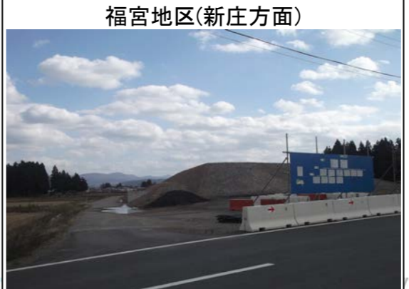
福宮地区(新庄方面)