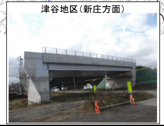
津谷地区(新庄方面)