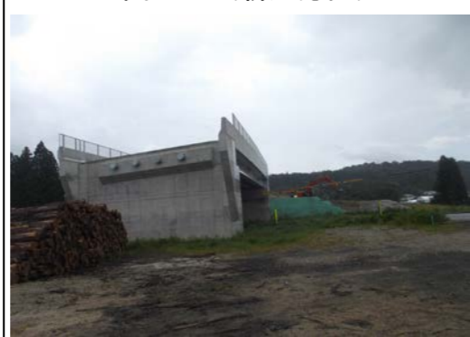
津谷地区(新庄方面)