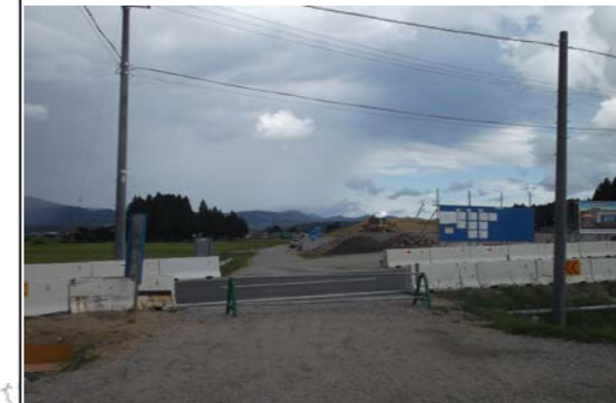
福宮地区(新庄方面)