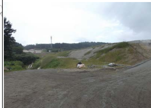
津谷地区(酒田方面)