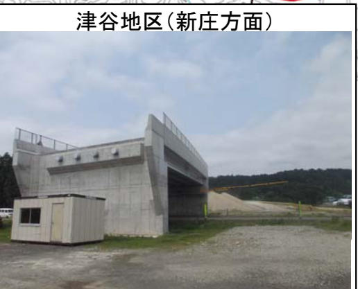
津谷地区(新庄方面)