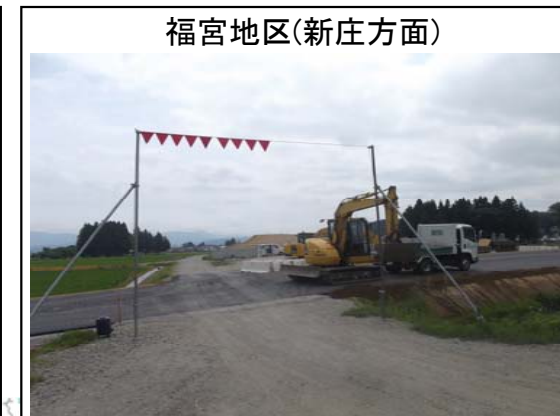
福宮地区(新庄方面)