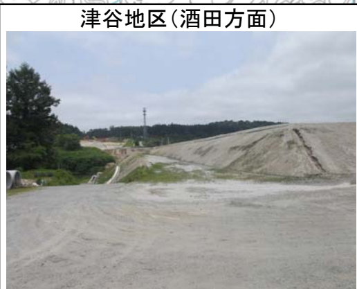
津谷地区(酒田方面)