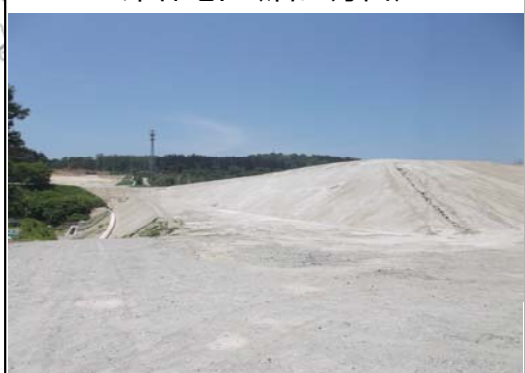
津谷地区(酒田方面)