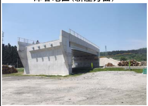
津谷地区(新庄方面)