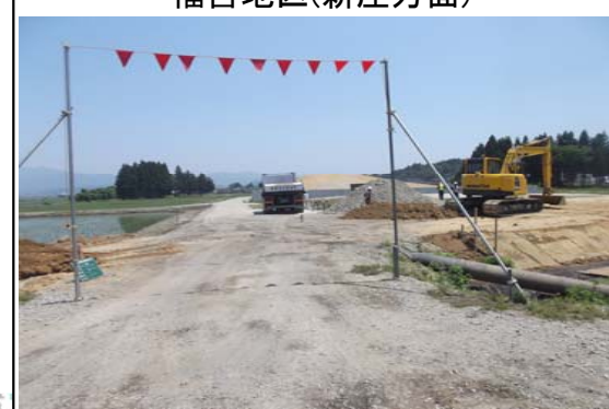
福宮地区(新庄方面)