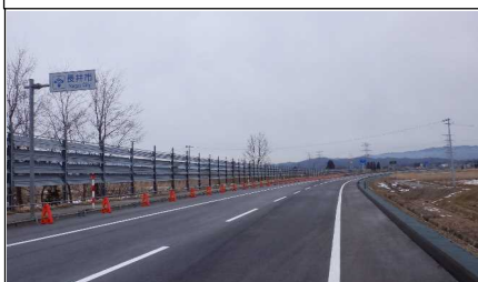
梨郷道路起点 (南陽方向)