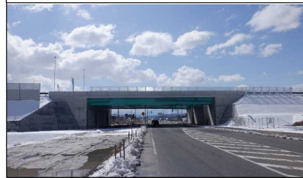
川西こ道橋 付近 (南陽方向)