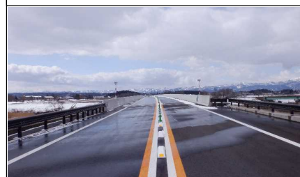
新幸来橋 (小国方面)