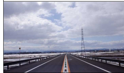
南陽市竹原地内 (小国方向)