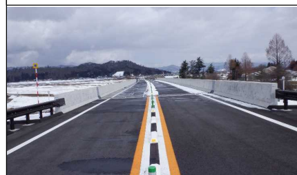
元宿川橋 (南陽方向)