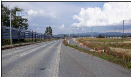
梨郷道路起点 (南陽方向)