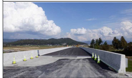
元宿川橋 (南陽方向)