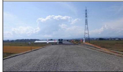
南陽市竹原地内 (小国方向)