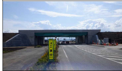
川西こ道橋 付近 (南陽方向)