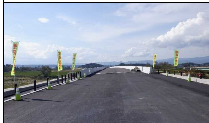
新幸来橋 (小国方面)