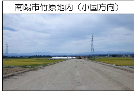
南陽市竹原地内(小国方向)