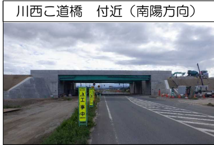
川西こ道橋 付近(南陽方向)