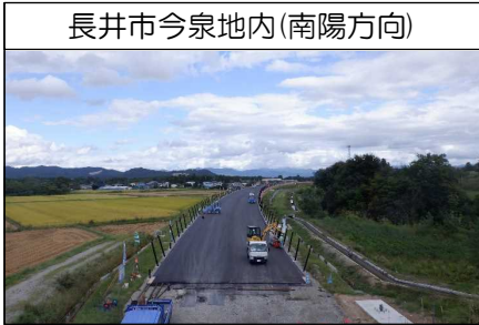
長井市今泉地内(南陽方向)