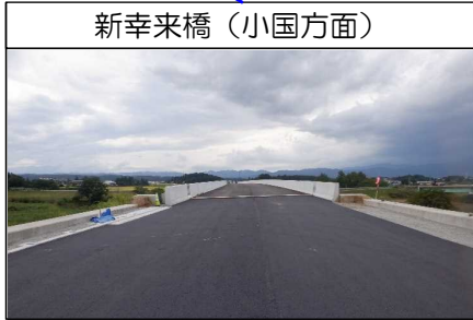
新幸来橋(小国方面)