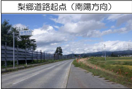
梨郷道路起点(南陽方向)