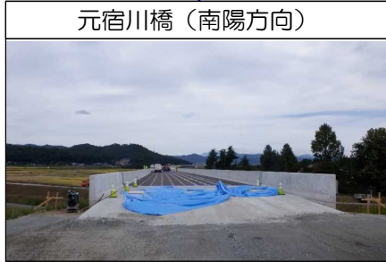
元宿川橋(南陽方向)