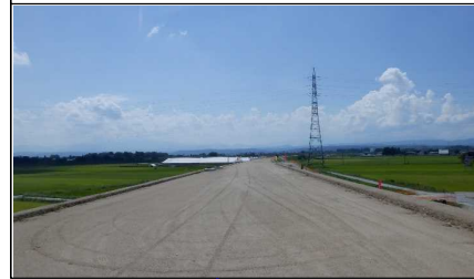
南陽市竹原地内 (小国方向)