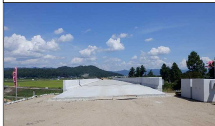
元宿川橋 (南陽方向)