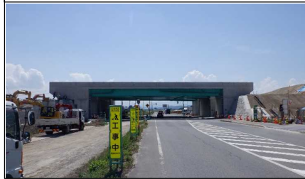
川西こ道橋 付近 (南陽方向)