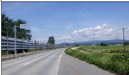
梨郷道路起点 (南陽方向)