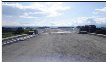
新幸来橋 (小国方面)