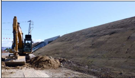
川西町西大塚 地内(高畠方向)