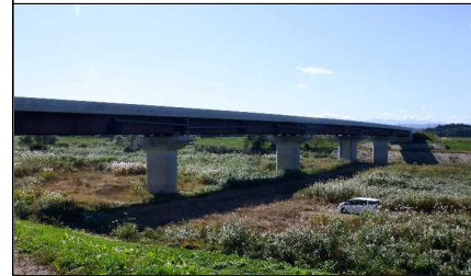
新幸来橋(小国方向)