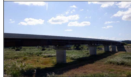
新幸来橋(小国方向)