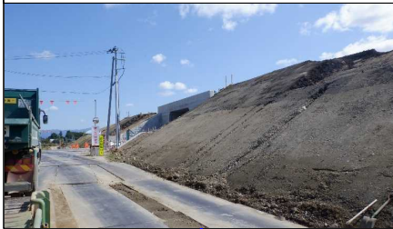
川西町西大塚 地内(高畠方向)