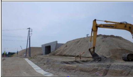
川西町西大塚 地内(高畠方向)