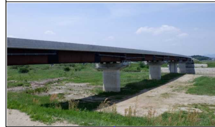
新幸来橋(小国方向)