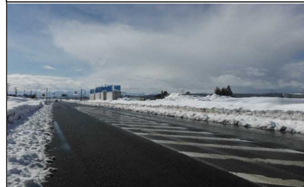
川西町西大塚 地内(小国方向)