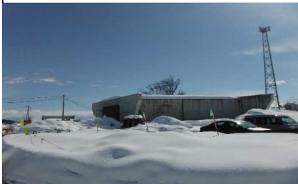
川西町西大塚 地内(高富方向)