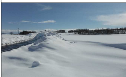
川西町西大塚 地内