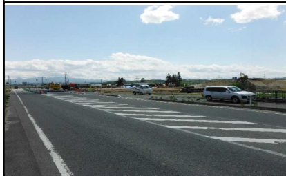
川西町西大塚 地内(長井方面)