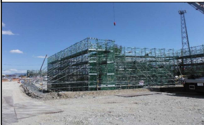
川西町西大塚 地内(米沢方面)