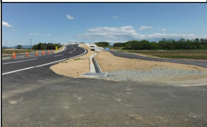
川西町西大塚 地内