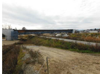
川西町大塚 地内(長井方向)