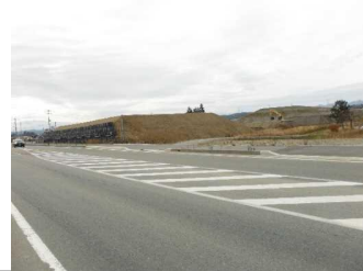
川西町西大塚 地内(長井方向)