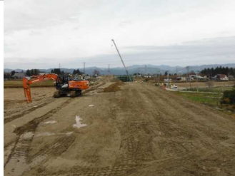
川西町西大塚 地内(長井方向)