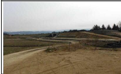
川西町大塚 地内 (米沢方面)