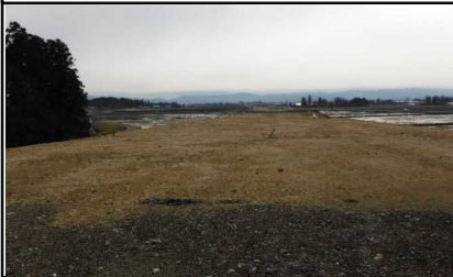
川西町西大塚 地内 (米沢方面)