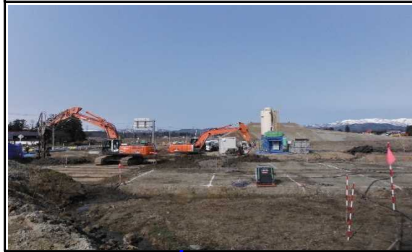
川西町西大塚 地内 (長井方面)