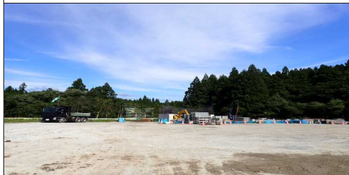
横川に線橋 起点側