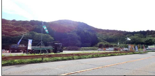
小国トンネル 終点側