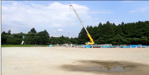
横川こ線橋 起点側