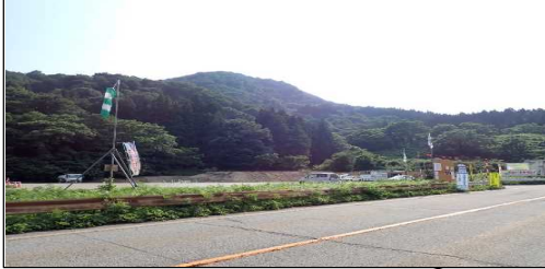
小国トンネル 終点側