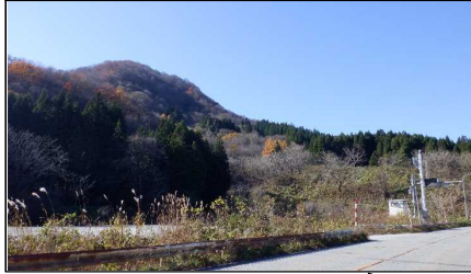
小国トンネル 終点側