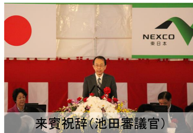
来賓祝辞(池田審議官)