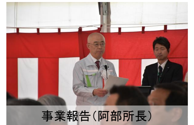
事業報告(阿部所長)