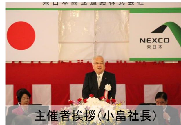
主催者挨拶(小島社長)