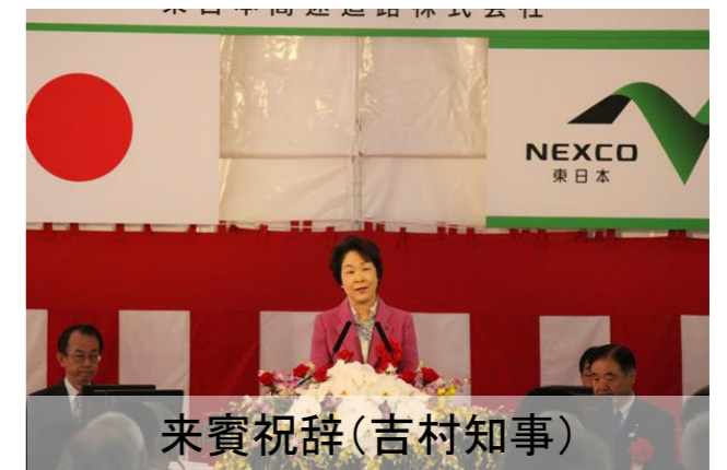
来賓祝辞(吉村知事)