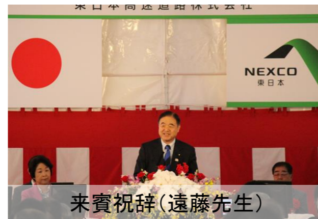
来賓祝辞(遠藤先生)