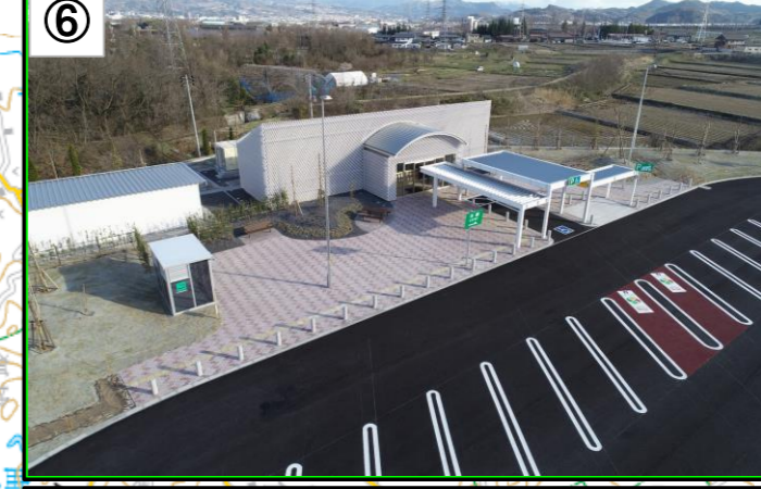
悪戸地区: 山形PA(下り)