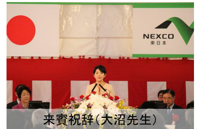
来賓祝辞(大沼先生)