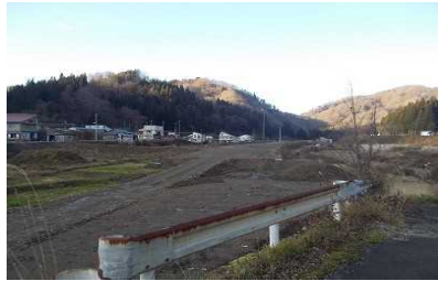
及位地区(横手方向)