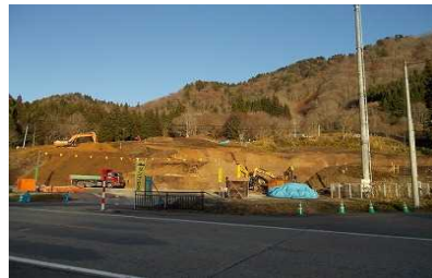
及位地区(新庄方向)