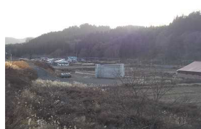
及位地区(新庄方向)