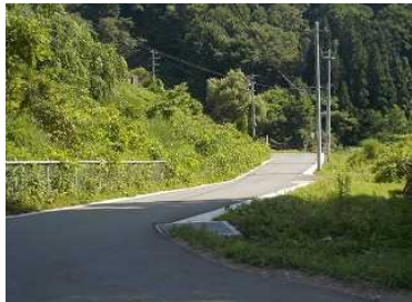
及位地区(町道付替)