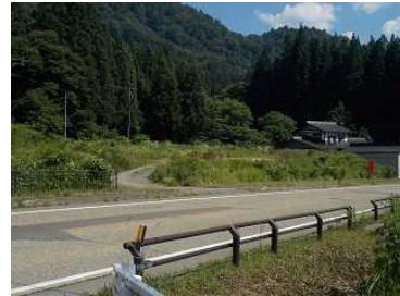
及位地区(新庄方向)