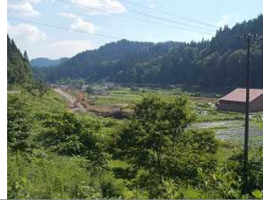
及位地区(新庄方向)