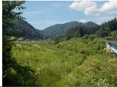
及位地区(横手方向)