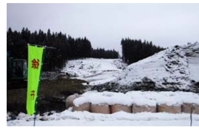
泉田大橋付近 (金山方面)