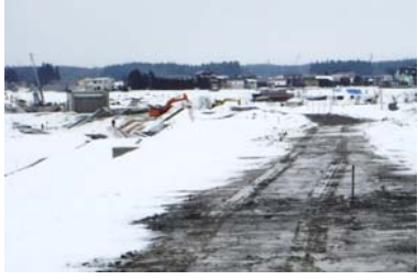
十日町(谷地小屋東)地区 (金山方面)