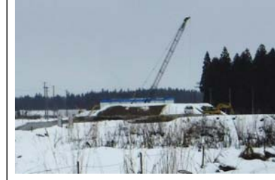
十日町(中川原)地区 (金山方面)