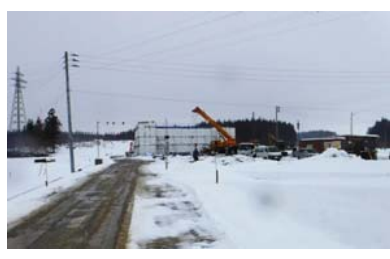
十日町(中向野)地区 (金山方面)