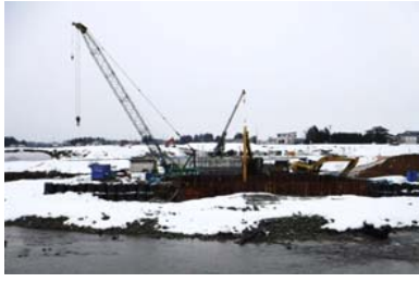
泉田川橋 (金山方面)