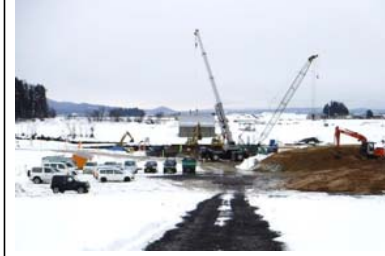
泉田川橋 (新庄方面)