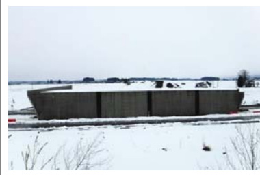
十日町(下谷地小屋)地区 (金山方面)