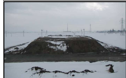
浮沼地区(山形方向)