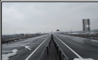
羽入地区(新庄方向)