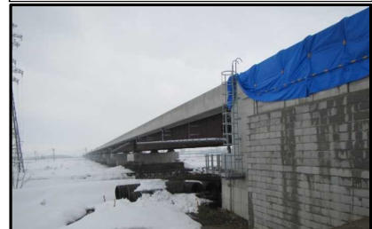
西郷高架橋A2側(山形方向)