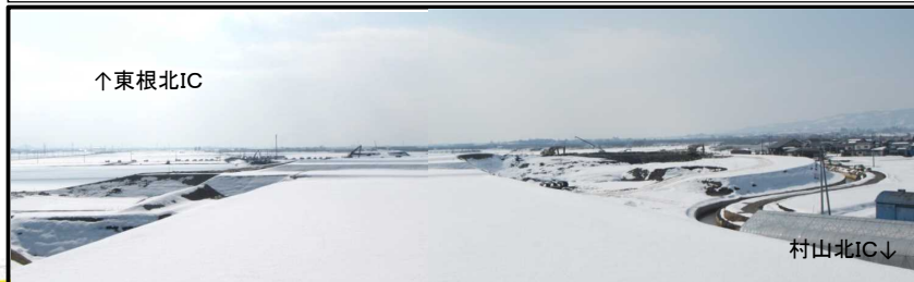
村山IC(仮称) (山形方向)