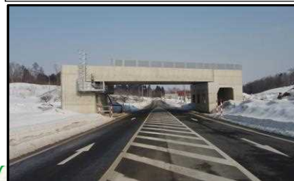
村山北(1)IC橋 (新庄方向)