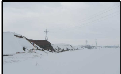
西郷地区(山形方向)