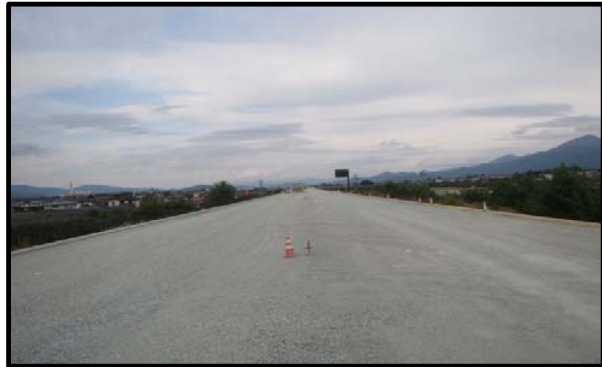
羽入地区(新庄方向)