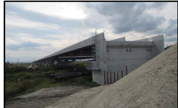
西郷高架橋A2側(山形方向)