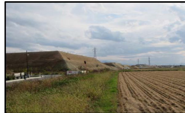
西郷地区(山形方向)