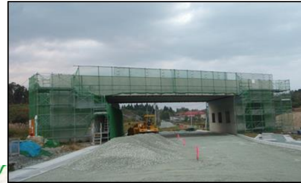
村山北(1)IC橋 (山形方向)