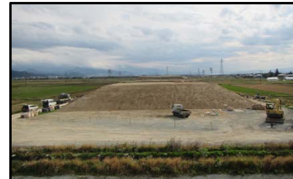
浮沼地区 (山形方向)