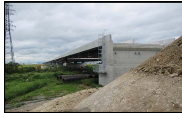
西郷高架橋A2側(山形方向)