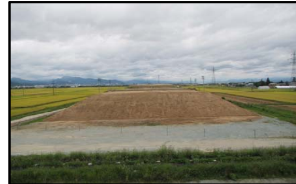
浮沼地区 (山形方向)