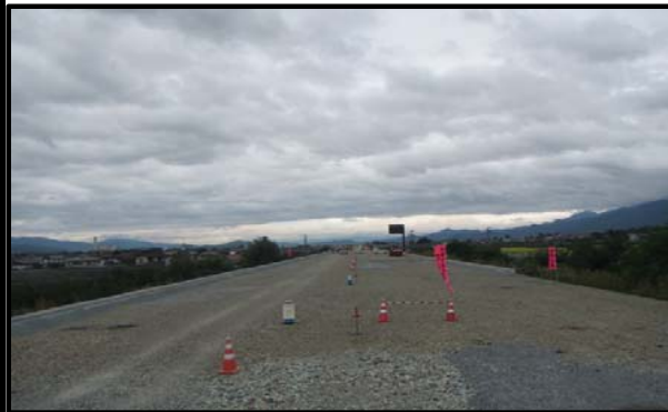
羽入地区(新庄方向)