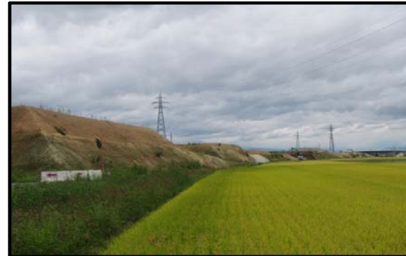
西郷地区(山形方向)