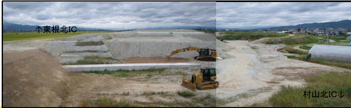
村山IC(仮称) (山形方向)