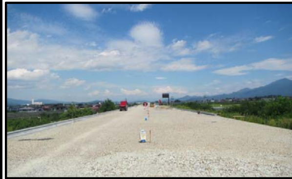
羽入地区(新庄方向)