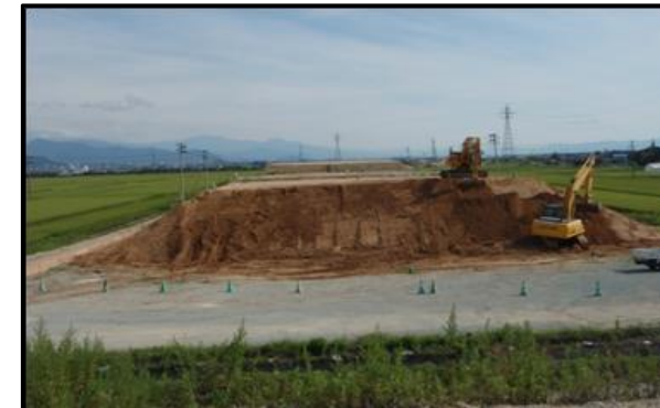
浮沼地区 (山形方向)