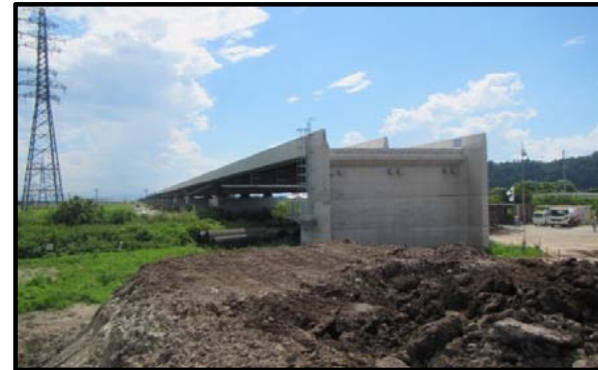
西郷高架橋A2側(山形方向)