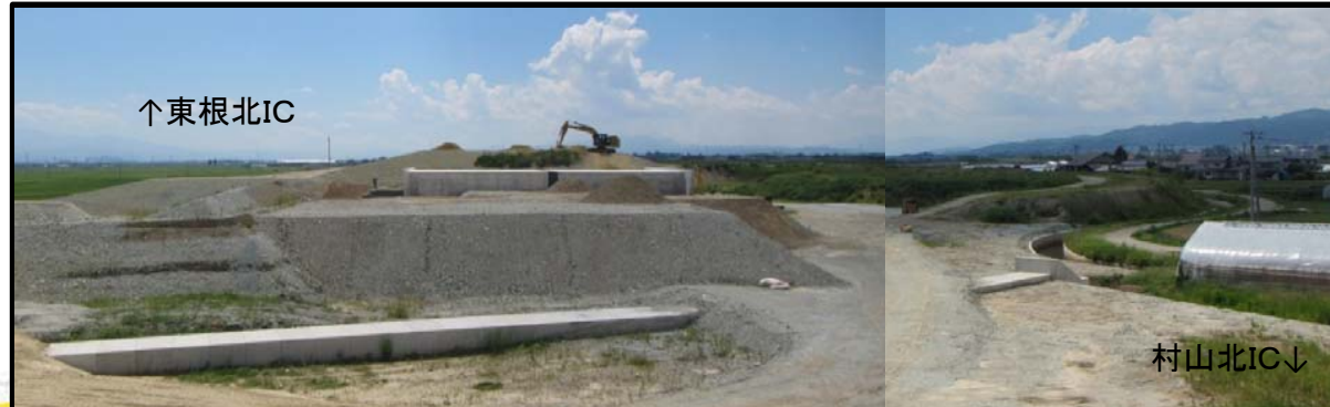
村山IC(仮称) (山形方向)