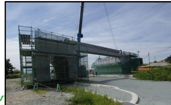
村山北(1)IC橋 (新庄方向)