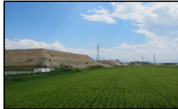
西郷地区(山形方向)