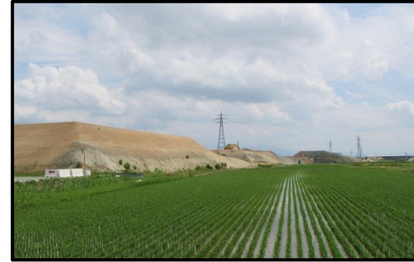
西郷地区(山形方向)