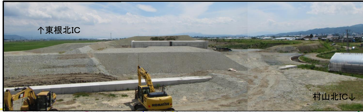
村山IC(仮称) (山形方向)