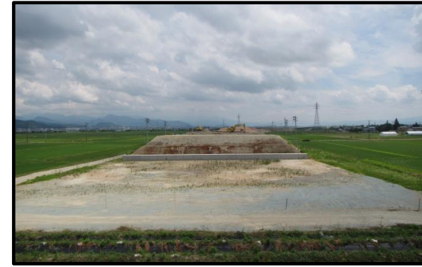
浮沼地区 (山形方向)