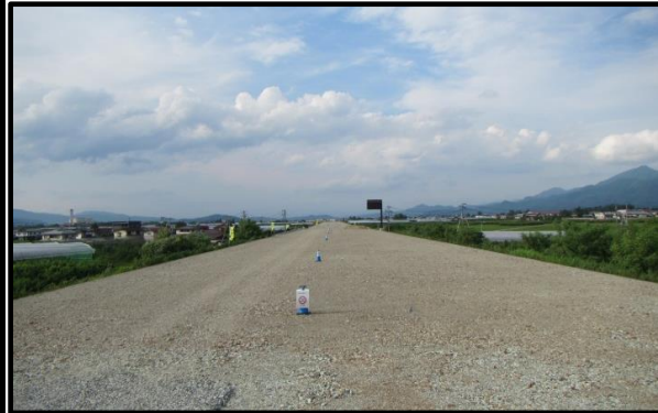
羽入地区(新庄方向)