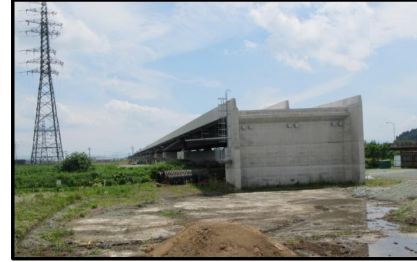
西郷高架橋A2側(山形方向)