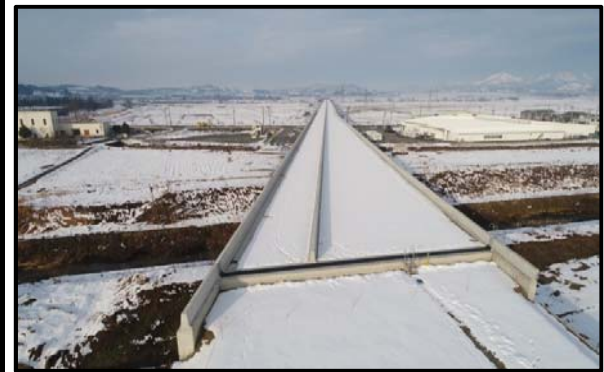
西郷高架橋A1側(新庄方向)