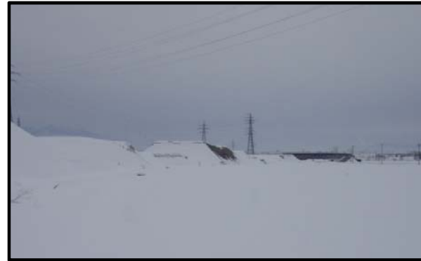
西郷地区(山形方向)