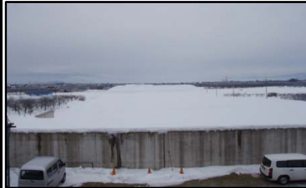
東根北IC(仮称)(山形方向)