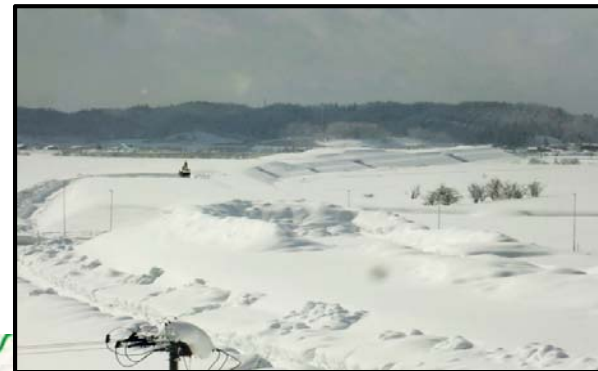
大石田村山IC(山形方向)