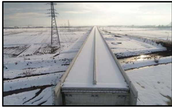
西郷高架橋A2側(山形方向)