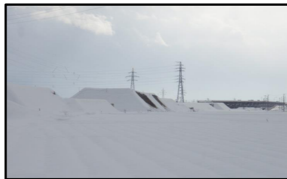
西郷地区(山形方向)