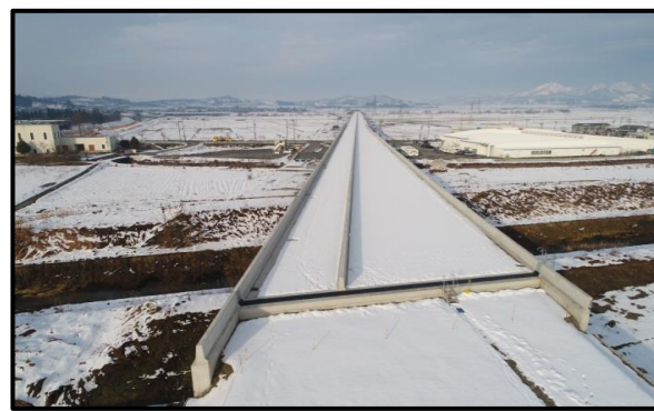
西郷高架橋A1側(新庄方向)