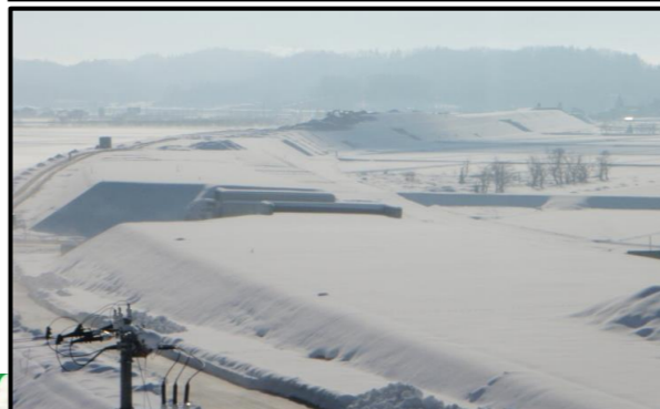
大石田村山IC(山形方向)