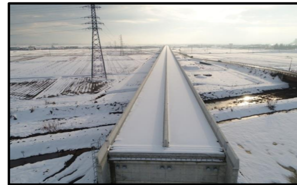
西郷高架橋A2側(山形方向)