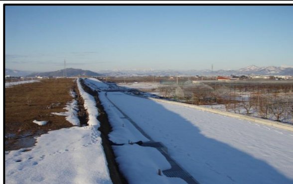
東根北IC(仮称)(新庄方向)