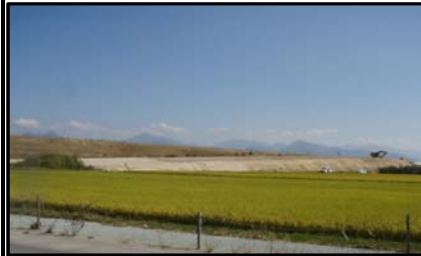
東根北IC(仮称)(山形方向)