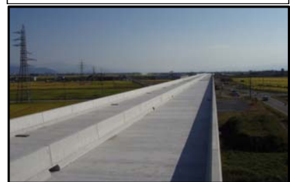
西郷高架橋A2側(山形方向)