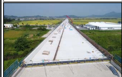
西郷高架橋A1側(新庄方向)