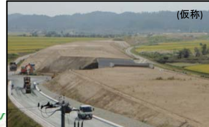
大石田村山IC(山形方向)