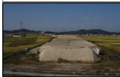
西郷地区(新庄方向)