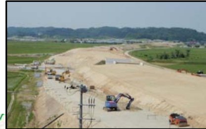
大石田村山IC(山形方向)