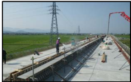
西郷高架橋A2側(山形方向)