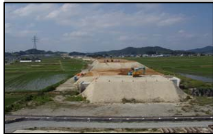
西郷地区(新庄方向)