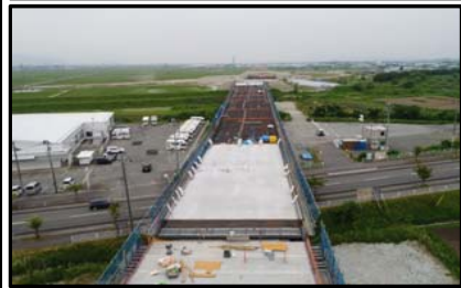
西郷高架橋P5側(山形方向)