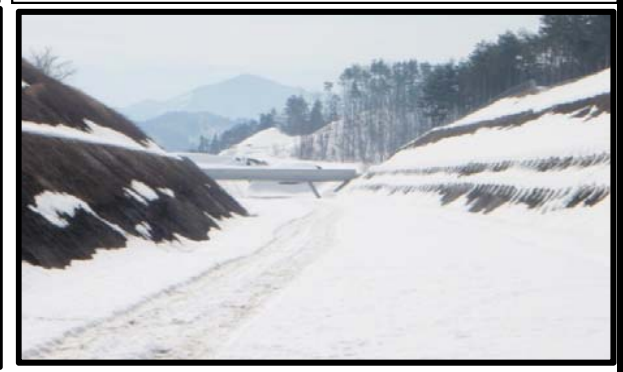
鳥木沢地区(山形方向)