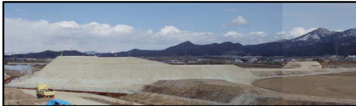
村山IC(仮称)(新庄方向)