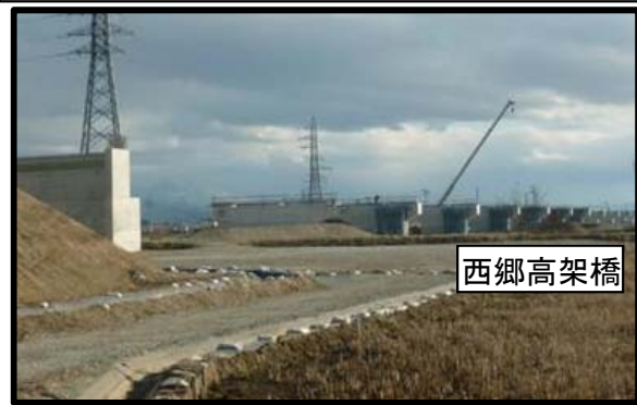
西郷地区(山形方向)