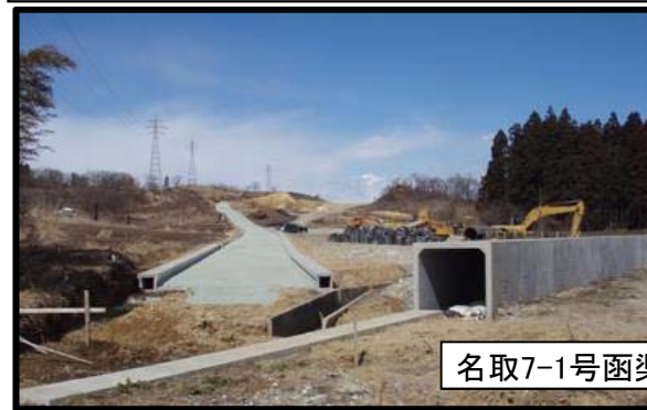
名取地区(新庄方向)