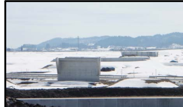
村山大石田IC(仮称)(山形方向)