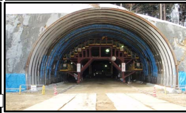
村山トンネル(終点側坑口)