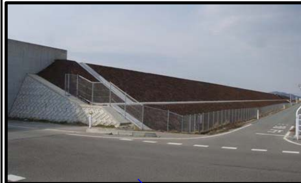
野田地区(新庄方向)