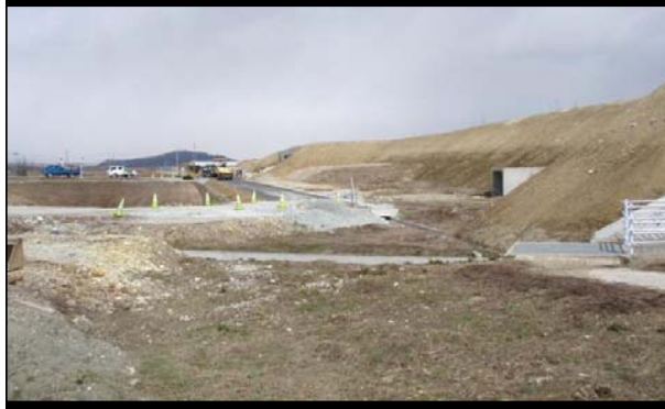
島大堀地区(新庄方向)