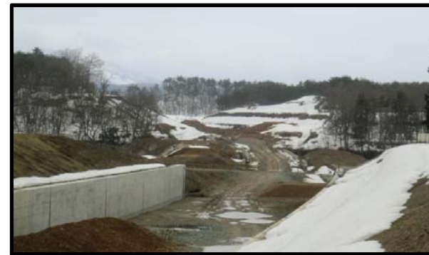
烏木沢地区(山形方向)