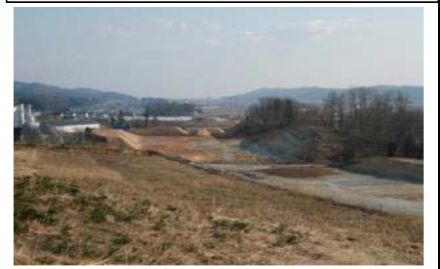
五十沢地区(山形方向)