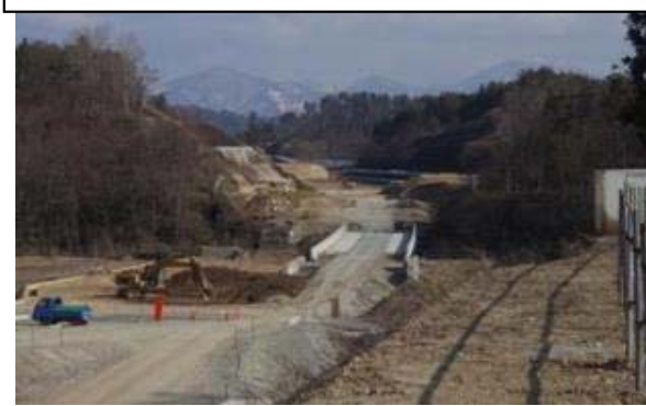
烏木沢地区(山形方向)