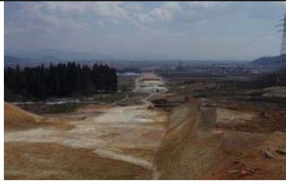
名取地区(山形方向)