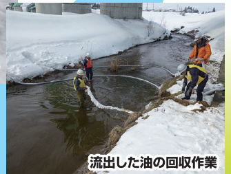
流出した油の回収作業