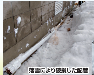
落雪により破損した配管