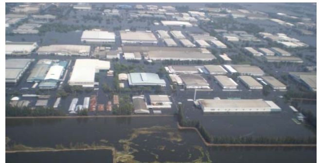
タイ国ロジャナ工業団地の浸水状況 (平成23年10月)