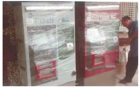
ハリケーン・サンディでの地下鉄会社の浸水防止の取組

（左：水のうによる止水対策、中央：ポイント部分のモーターの取り出し、右：券売機の止水対策）