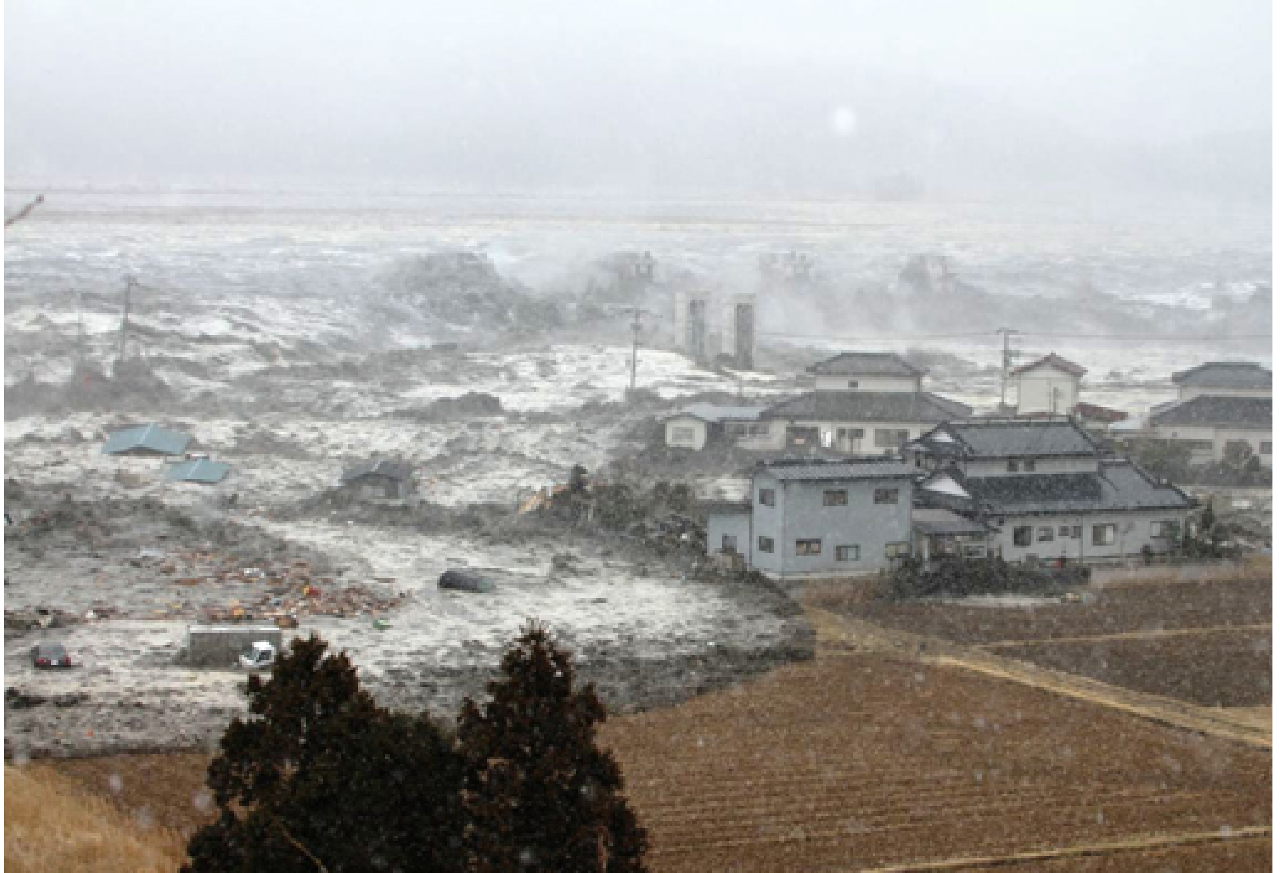
津波(宮城県石巻市)