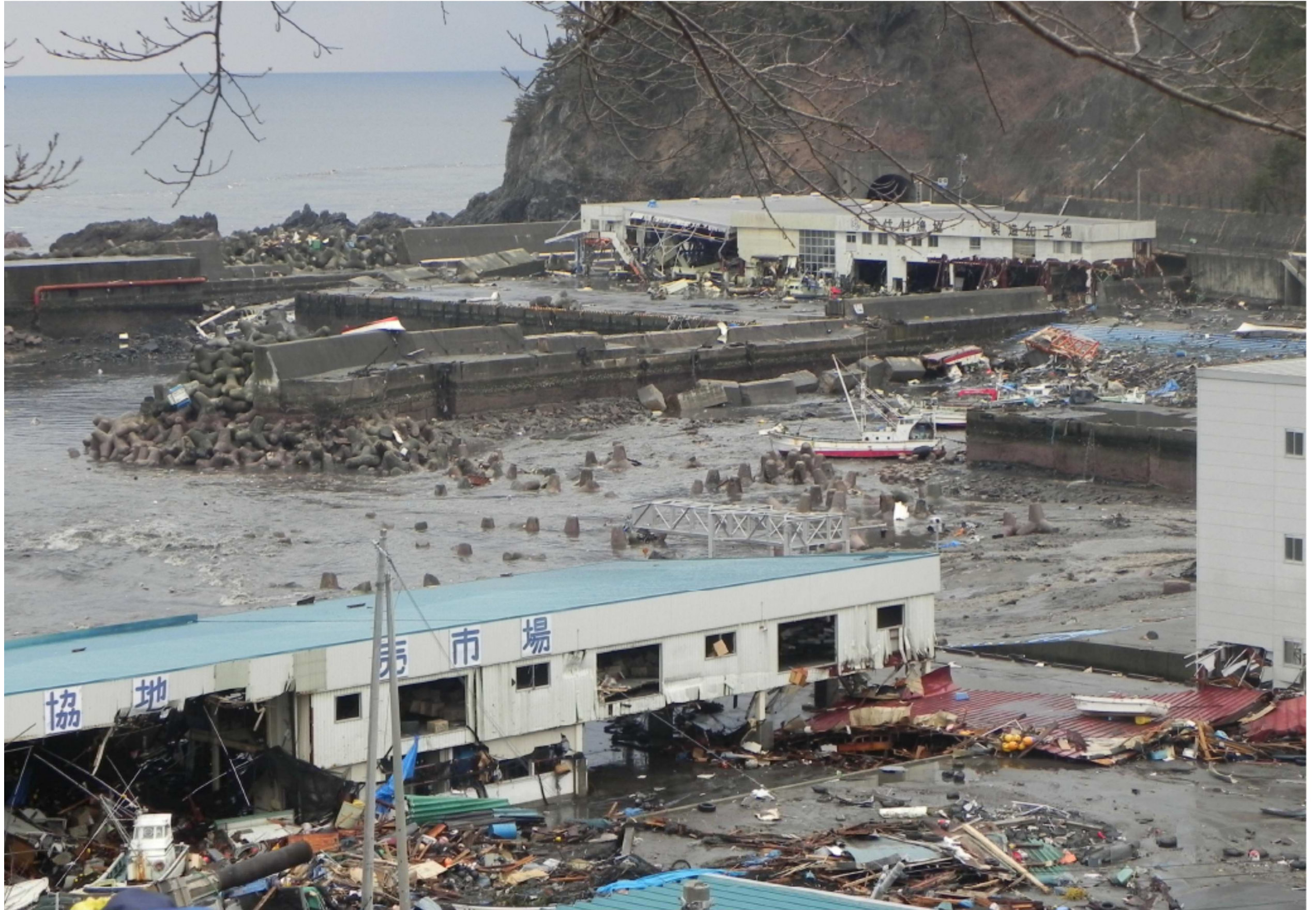
津波(岩手県普代村)