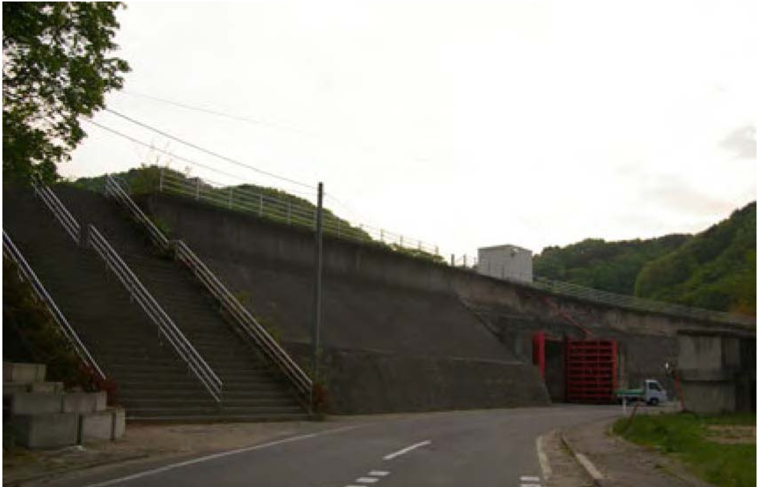
太田名部防潮堤(岩手県普代村)