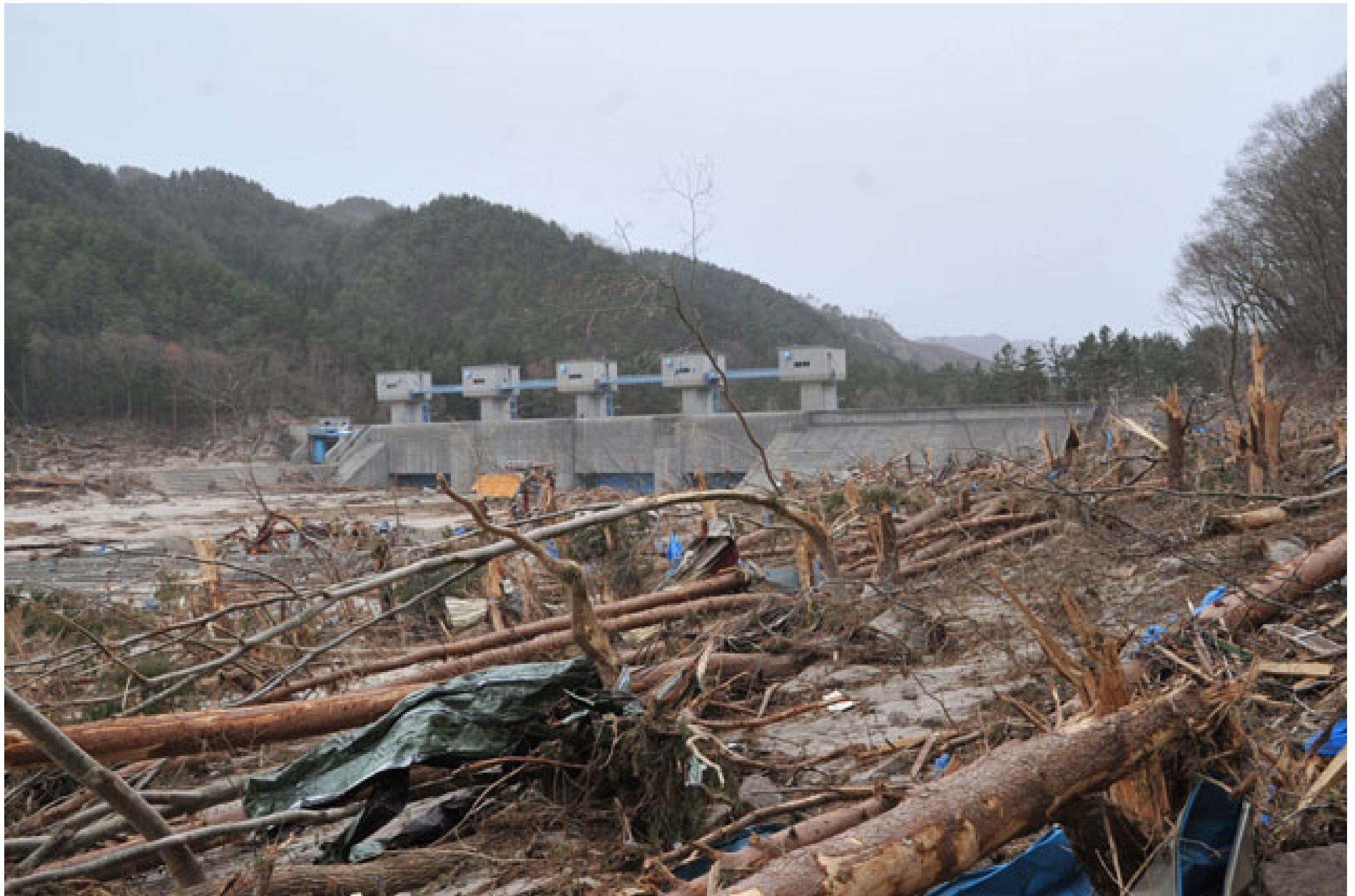
普代水門(岩手県普代村)