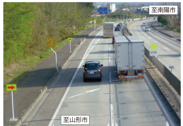
国道13号 金生南交差点付近の道路状況(車線減少)