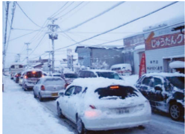
国道112号山形市内の冬期交通状況