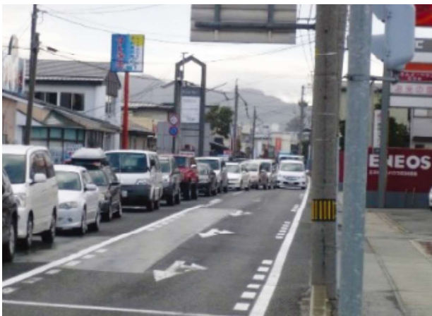
国道112号山形市内の交通混雑の状況